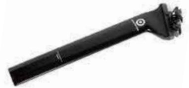
78° NAZARÉ1-2 SL TRI SEAT POST ¥19,800 (税別)

SEAT ANGLE : Adjustable seat tube angle up to 78 degrees SEAT CLAMP : Ritchey saddle clamp on monorail design WEIGHT : 0.24kg LENGTH : 350mm